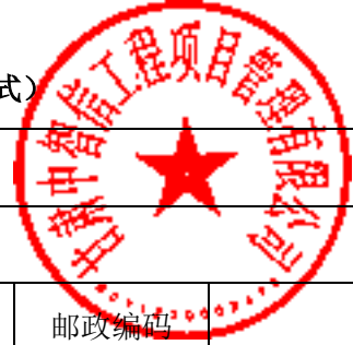
表 4.4.1 投标人基本情况表（格式）