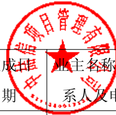
近三年类似业绩一览表